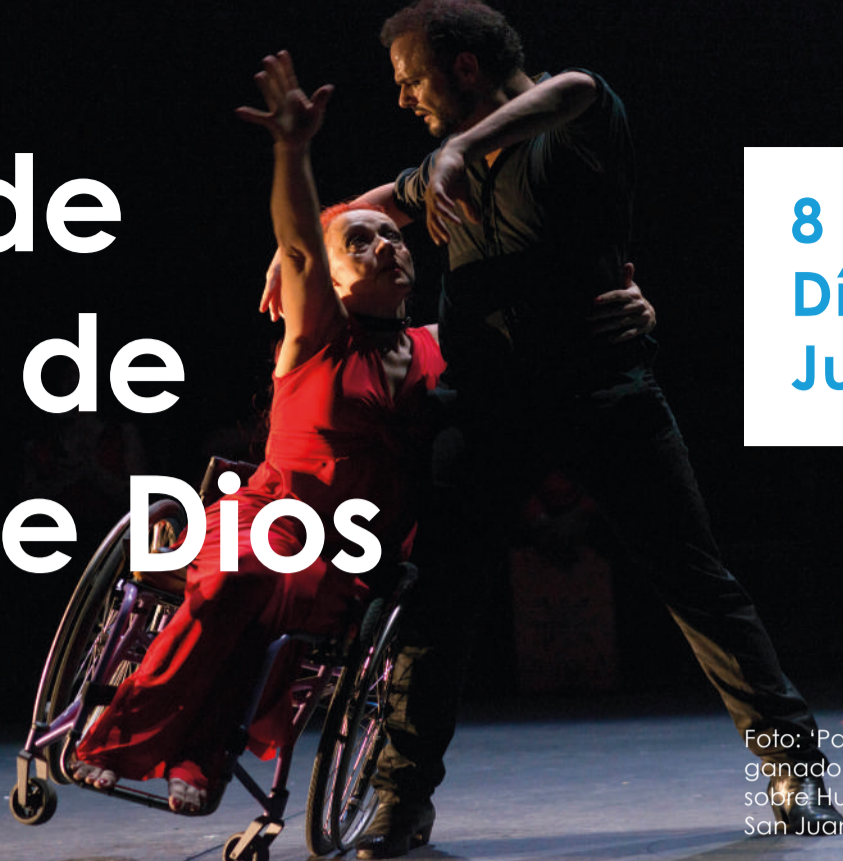
Foto: 'Pasos de Baile', de Antonio Jesús, ganadora del XI Concurso de Fotografía sobre Humanización Asistencial Hospital San Juan de Dios de León.